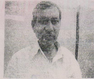
उप / सयुक्त पंजीयन अधिकारी